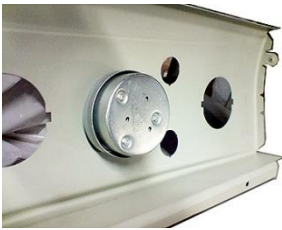
Timer na parte de trás do painel, instalação muito simples.

Por exemplo, o Modelo DAKO Magister, CIVIC, Diplomata e GE. Repare que a furação das trempes estão no mesmo lugar. Seguem imagens.