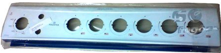
Painel DAKO Magister 6 bocas com 2